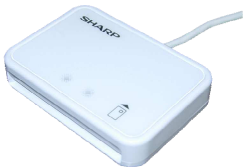
シャープ製：RW-5100 対応：Windows8.1まで