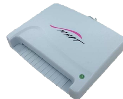
スマートワイヤレス製：ACR-30U 対応：WindowsVistaまで (現ICカード非対応)