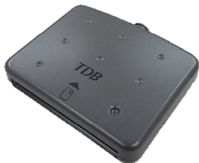
シャープ製：SSC-001 対応：Windows7まで