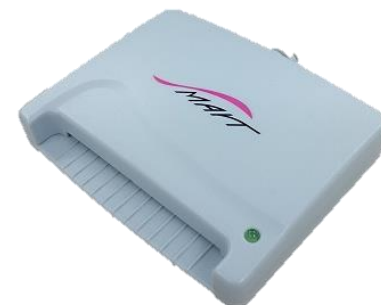
スマートワイヤレス製：ACR-30U 対応：WindowsVistaまで (現ICカード非対応)