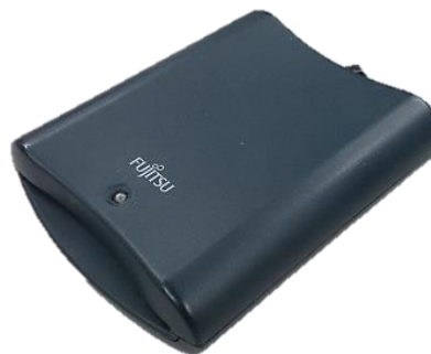
富士通製：F3972G403 対応：Windows7まで (現ICカード非対応)