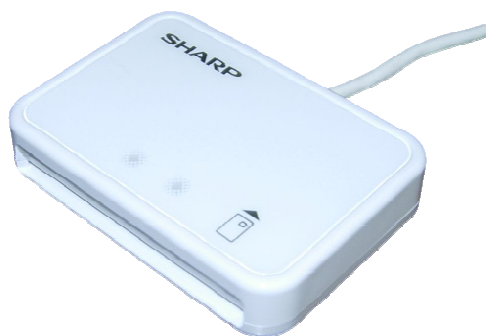
シャープ製：RW-5100 対応：Windows8.1まで