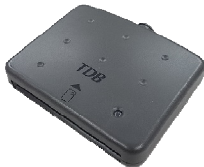
シャープ製：SSC-001 対応：Windows7まで