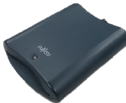
富士通製：F3972G403 対応：Windows7まで (現ICカード非対応)