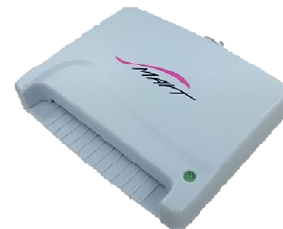
スマートワイヤレス製：ACR-30U 対応：WindowsVistaまで (現ICカード非対応)