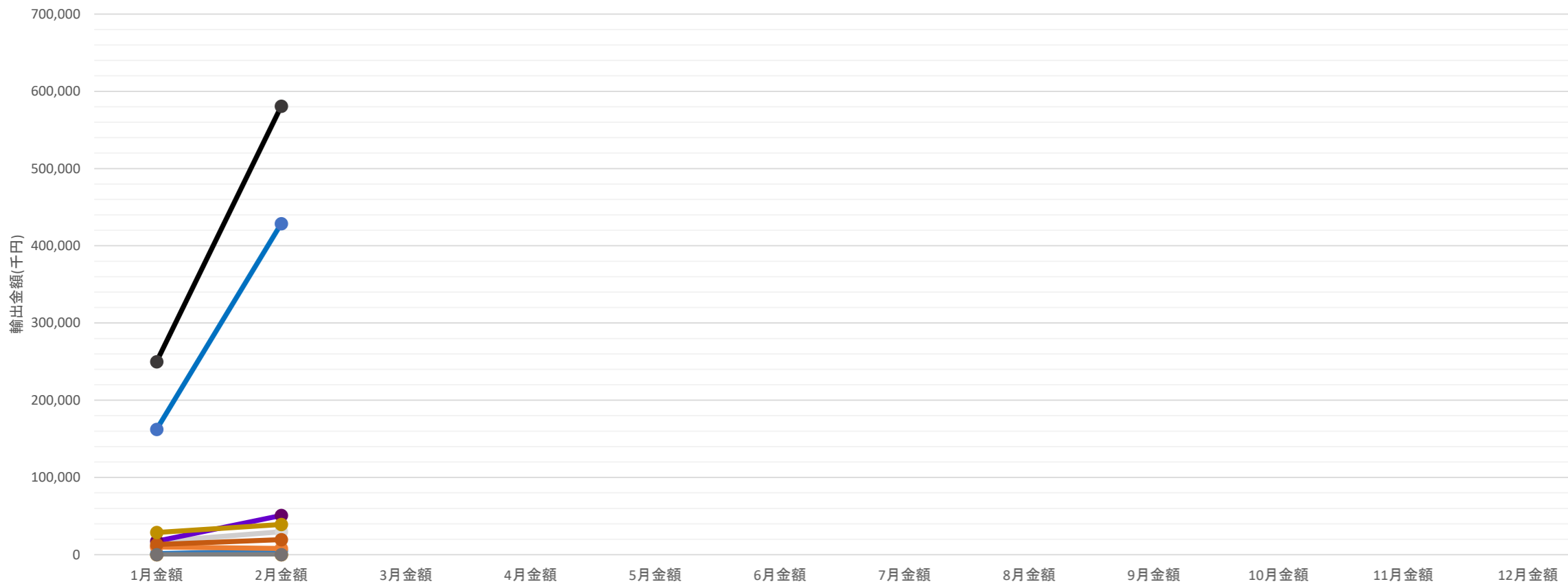
【HS39.15.90.190 PETフレーク 金額】

大韓民国 中華人民共和国 台湾 香港 バトナム タイ マレーシア インドネシア パキスタン アメリカ合衆国 合計