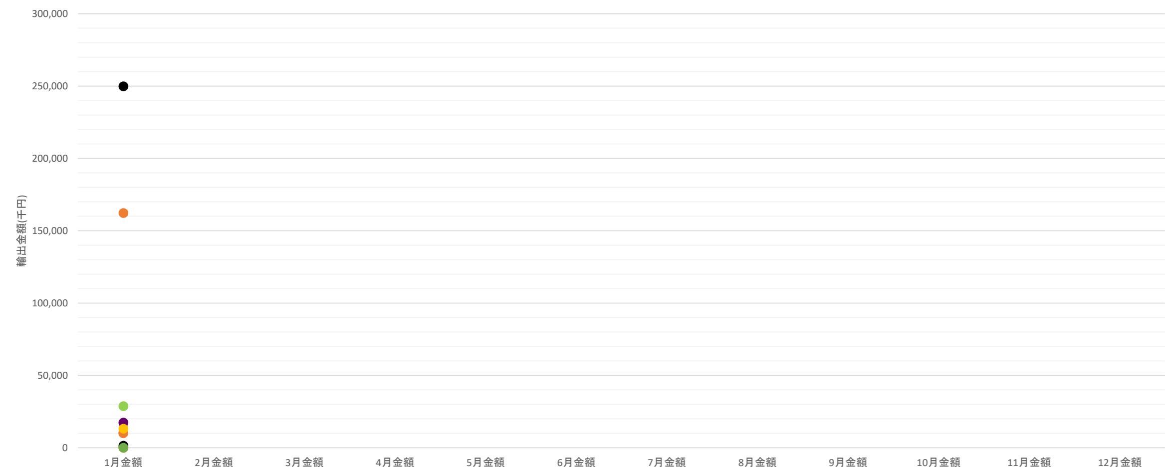
【HS39.15.90.190 PETフレーク 金額】

大韓民国 中華人民共和国 台湾 香港 ベトナム タイ マレーシア インドネシア パキスタン アメリカ合衆国 合計