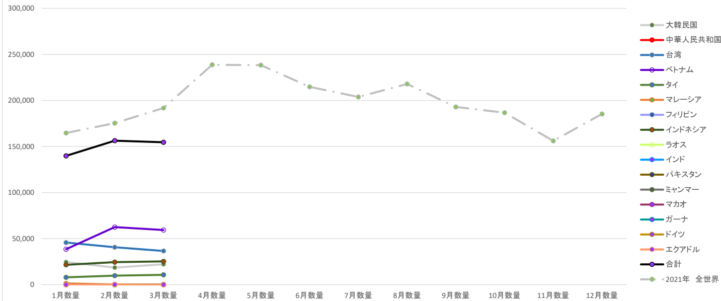
古紙輸出統計 2022年3月 数量