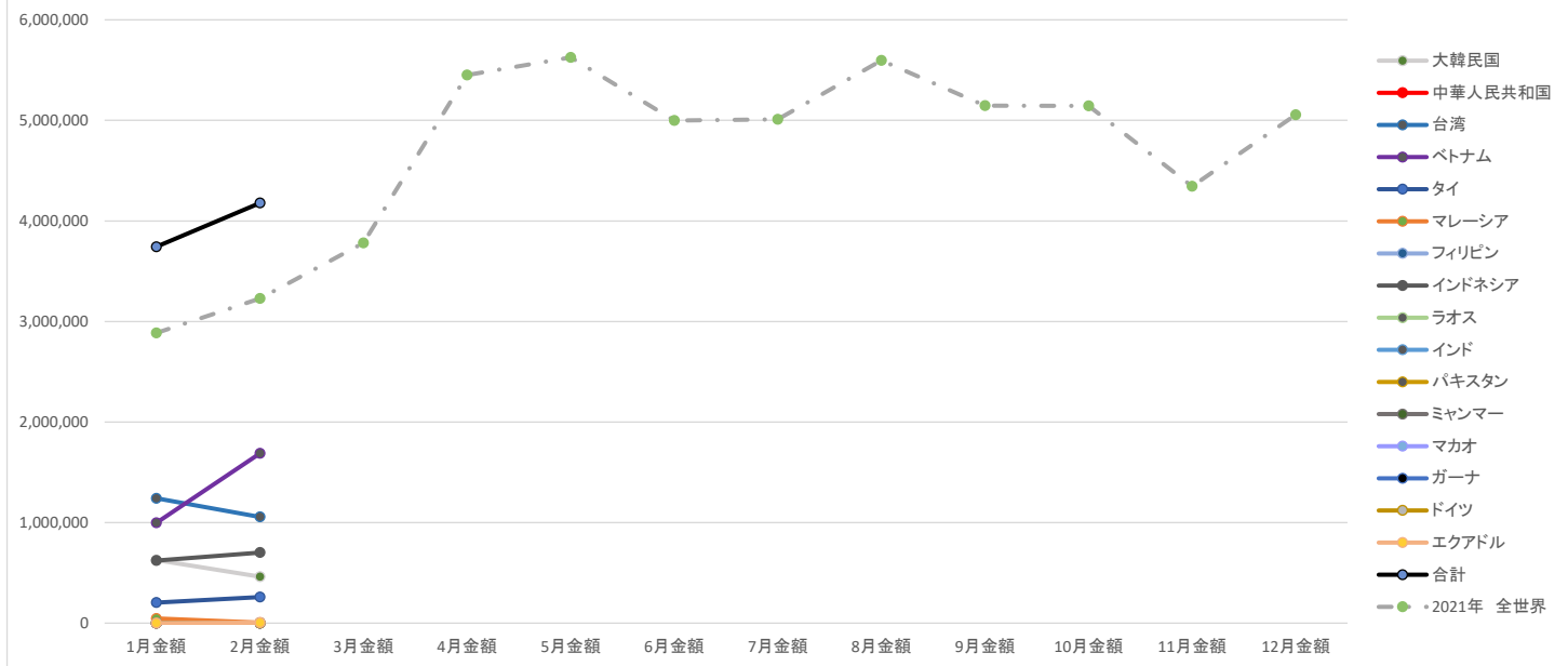
古紙輸出統計 2022年2月 金額