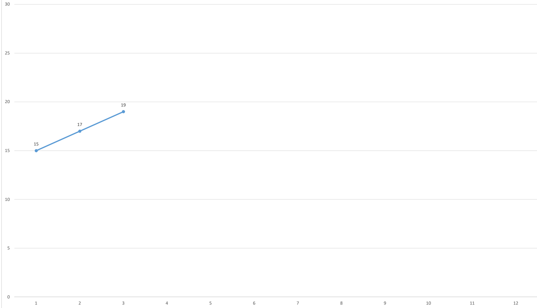
プラスチックくずの輸出対象国・地域数