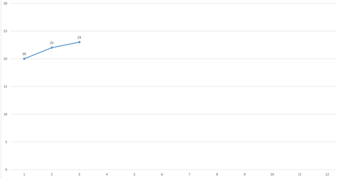
プラスチックくずの輸出対象国・地域数