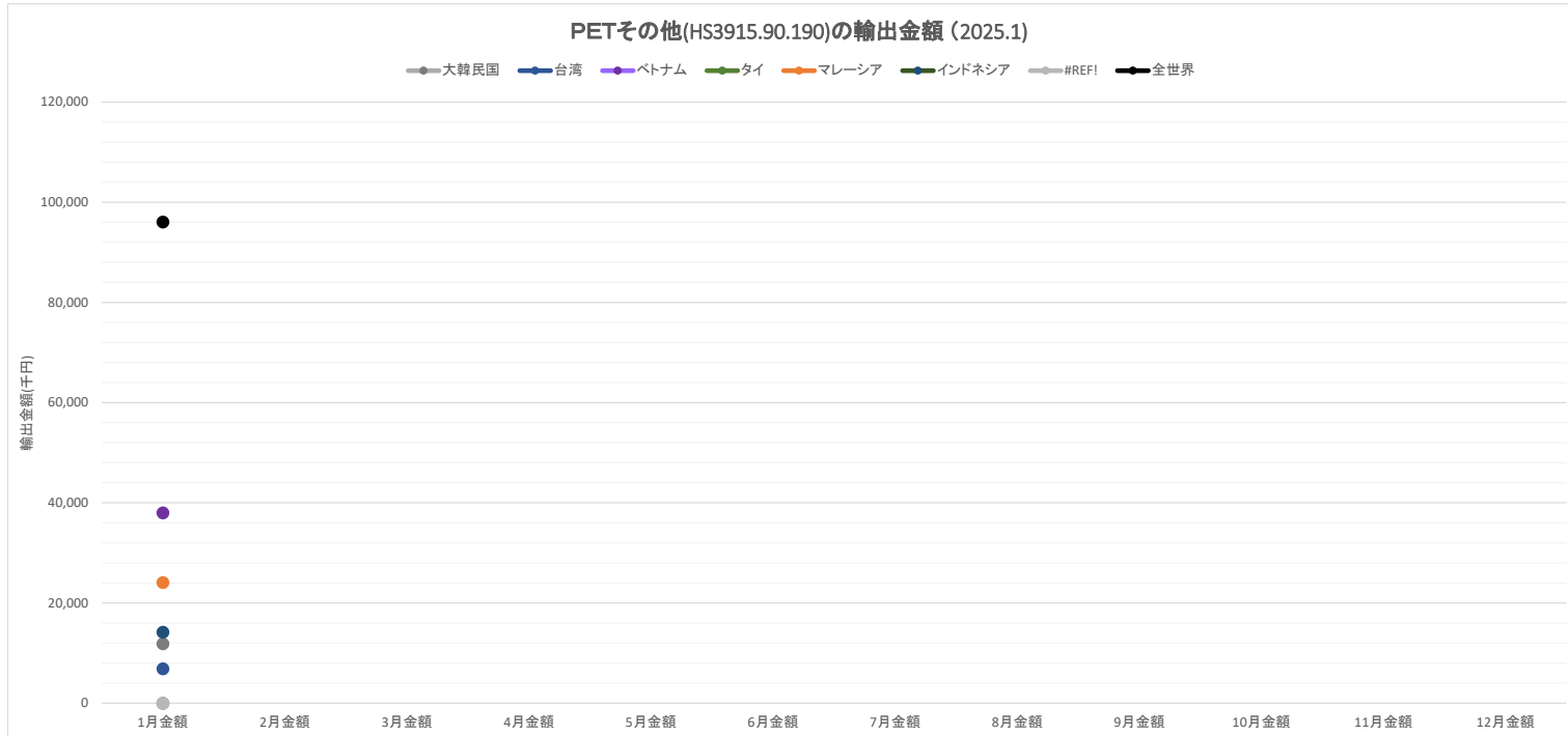
【HS39.15.90.190 PETその他 金額】